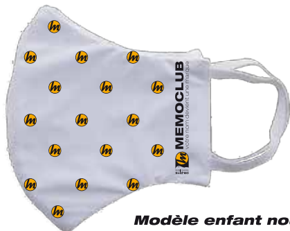
Modèle enfant nous contacter

tissus OEKO-TEX 100% polyester (140gr / m 2 ) et 100% coton (140 gr / m 2 ) 100% personnalisable 100ex PU 4.08 €ht 200ex PU 3.08 €ht sous 2-3 semaines au bat